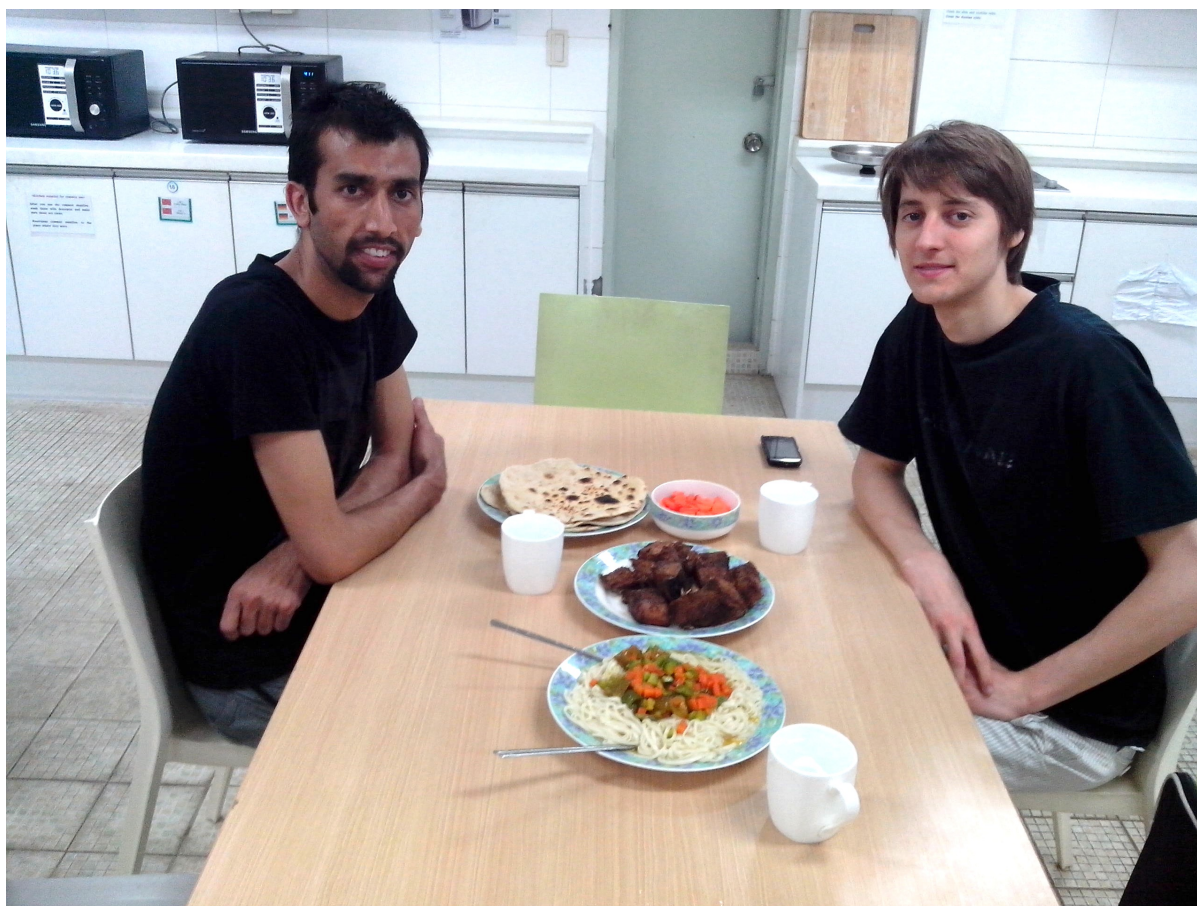
Indický chléb čapati a čínské nudle v kuchyňce pro kolejní studenty.

Residentům na koleji je zdarma k dispozici kuchyňka (open-kitchen), kterou využívají zejména cizinci ze všech koutů světa pro přípravu speciálních jídel. Je to možnost vzájemně se přiučit kulinářskému umění a nasát zvyky jiných kultur. Bohužel nebylo možné vynášet jídlo ven, ani přizvat na jídlo nezaregistrované studenty, ale věřím, že se to podaří změnit, pokud se v kuchyňce bude udržovat pořádek a klid.