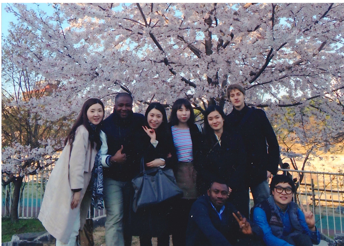
Výlet s přáteli z křesťanského kostela během jarního období rozkvětu třešňí (cherry blossom).

Jižní Korea je jedinečná způsobem, jakým spolu poklidně koexistují různé náboženské proudy. Jel jsem takhle kolejním výtahem, když jsem navázal rozhovor s jedním Nigerijcem. Domluvili jsme se, že mě později navštíví na pokoji. Přičítal se spolu se svým přítelem ze Zimbabwe. V životě jsem neviděl veselejší lidi než Afričany. Pozvali mě na bohuslužbu v nedalekém presbiteriánském kostele, kde jsem poznal nezapomenutelné přátele. Začal jsem navštěvovat jejich týdenní bohoslužby, kde se mi dostávalo ohromné lásky a kde z lidí, zpěvu, bicích, kytarové a klavírní hudby sálala obrovská energie plná vášně.