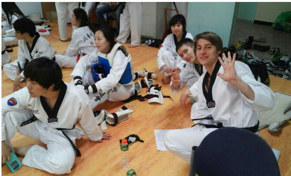
Sledování průběhu univerzitního turnaje v taekwondou.

Poštětilo se mi zkusit si korejské bojové umění taekwondo ve studentském klubu, kde nám později také nabídli účast v univerzitním turnaji. Soupeř mě očividně šetřil, ale i tak jsem měl co dělat, abych důstojně hájil náš tým s „mezinárodní posilou“ čítající zástupkyni z Číny, zástupce z Uzbekistánu a mě.