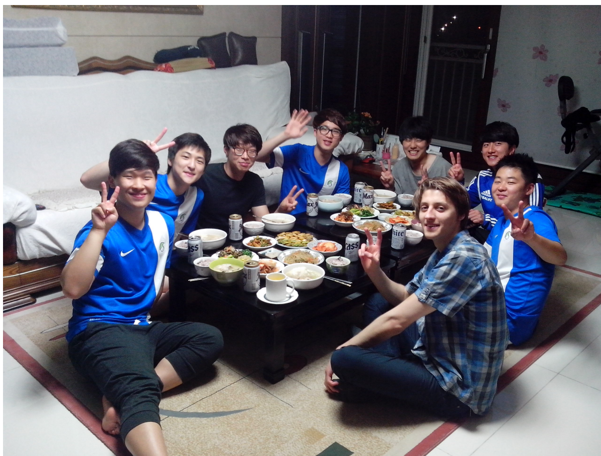
Večeře připravená rodinou jednoho z hráčů florbalového týmu SKKU.

Jednoho dne jsem si šel posedět a trochu pomeditovat na trávě v kampusu, kde si házel s míčem dva studenti ze sportovní školy. Dali jsme se do řeči a zjistil jsem, že na kampusu v Suwonu existuje poměrně nový kroužek florbalu. Když jsem na kroužek zavítal, byl jsem překvapen, jakou partu spolu drží při společném tréninku s ženským týmem. Po několika trénincích mě pozvali na dvoudenní univerzitní turnaj, který se konal v severním městě Pocheon. Na pohoštění, kterého se nám dostalo od rodiny jednoho z hráčů nikdy nezapomenu.