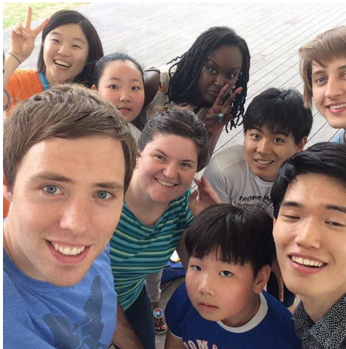
Záběr z rekreace spolku Chi Alpha Korea v parku poblíž kampusu.

Zrovna během semestru mého pobytu a právě na SKKU započal své působení v Jižní Koreji křesťanský spolek pro univerzitní studenty Chi Alpha pocházející z USA. Pravidelně jsme se scházeli, čerpali novou sílu a inspiraci a debatovali spolu s dalšími zahraničními i korejskými zájemci o Bibli. Na konci semestru, když jsme museli opustit kolej, mi po společné rekreaci, pikniku a hrách v nedalekém parku poskytl na jeden den nocleh člen z tohoto spolku.