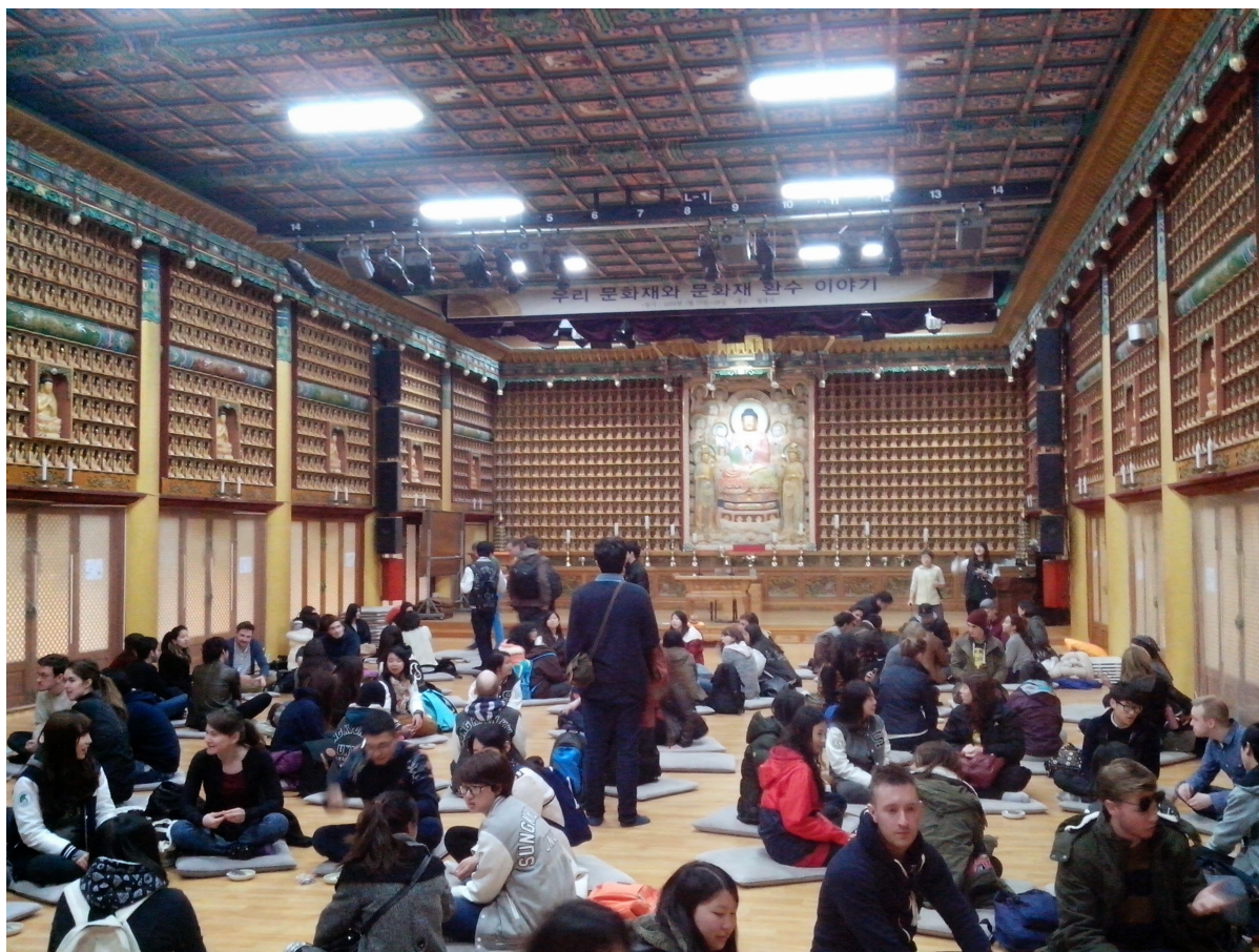
Exkurze do buddhistického chrámu Woljeongsa, kde jsme si po výkladu vyzkoušeli navlékání meditačních korálek.

S Koreou je neodmyslitelně spjata buddhistická nauka, která převládala v období korejského království a dynastie Silla, jedné ze světově nejdelších dynastií. Nebylo tedy náhodou, že dobrovolnická studentská skupina GSN HI-CLUB pro nás připravila kulturní exkurzi právě do buddhistického chrámu Woljeongsa v národní parku Odaesan, kde jsme měli možnost poobědvat v jídelně buddhistického řádu Jogye. Jak bývá mezi buddhisty zvykem, každý si po jejich vzoru umyl po jídle své nádobí.